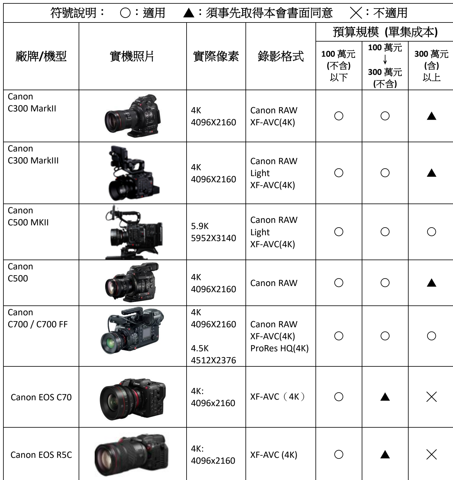
公視基金會 4K/UHD 攝影機適用對照表