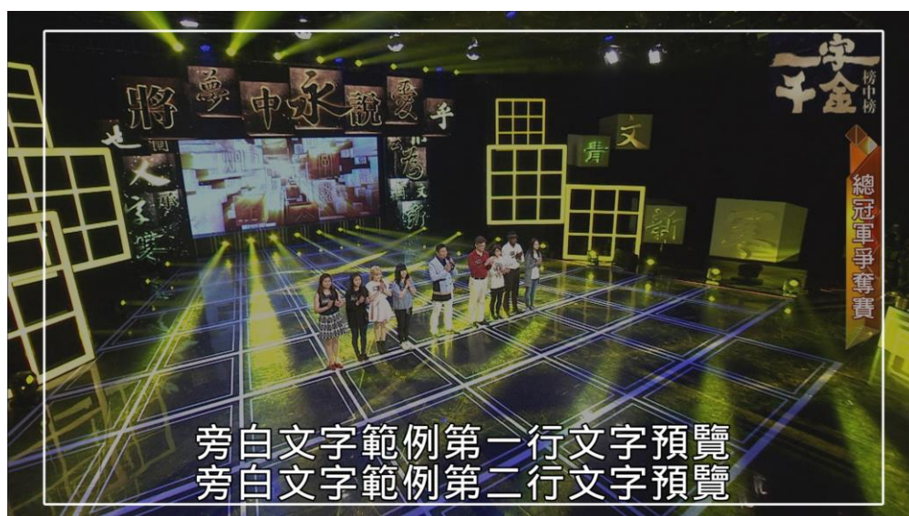
（上圖標示為 16：9 字幕安全框）