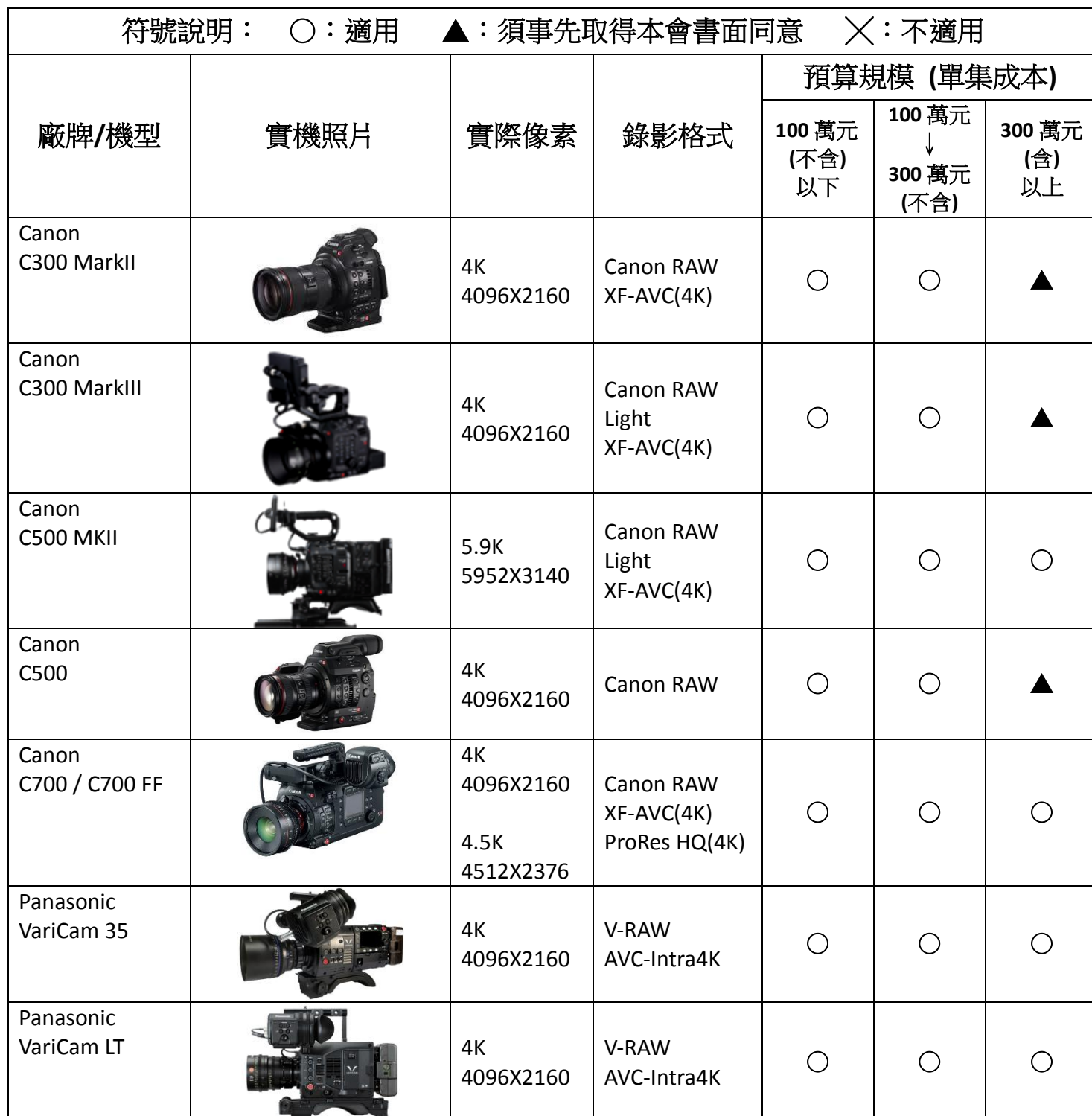
公視基金會 4K/UHD 攝影機適用對照表