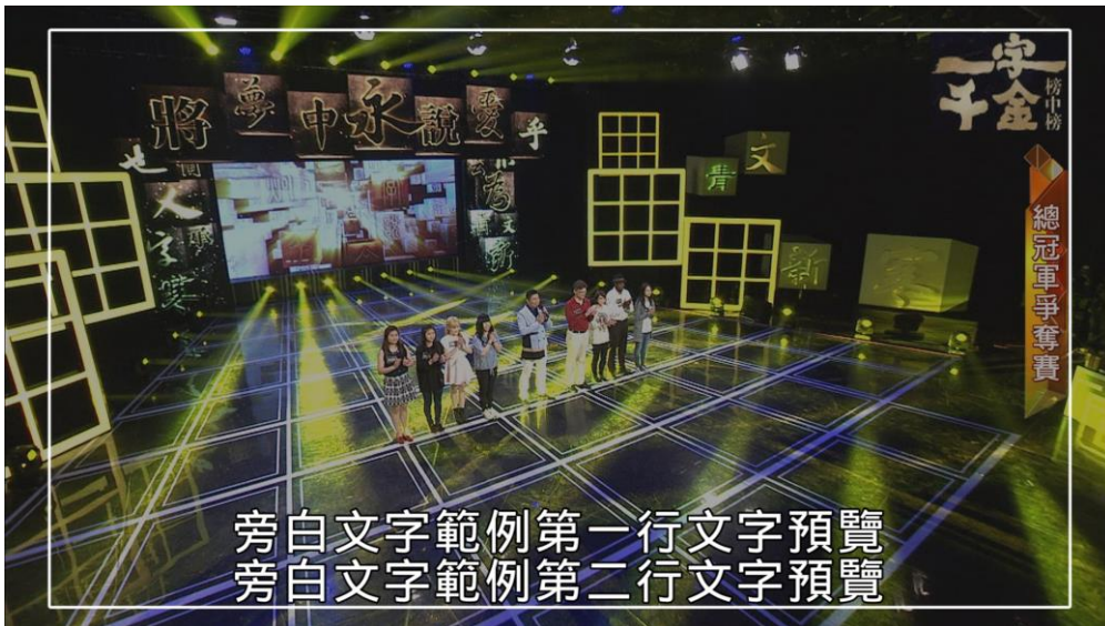
（上圖標示為 16：9 字幕安全框）