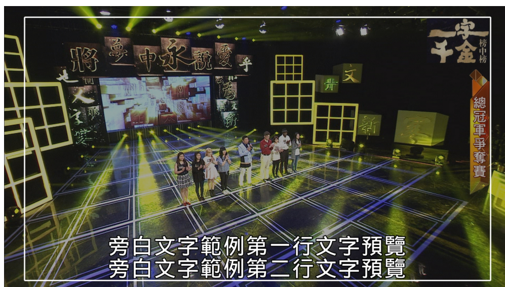
（上圖標示為 16：9 字幕安全框）