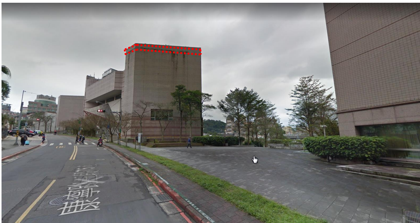
B 棟外牆施作位置示意圖-1