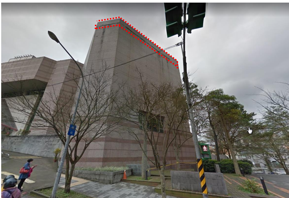
B 棟外牆施作位置示意圖-2