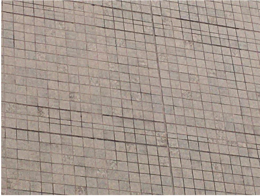
參考:現有外牆材質局部照片-1